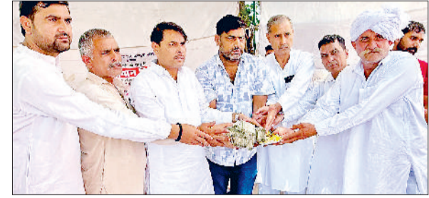
गोहाना। बाढ़ पीड़ितों के लिए एकत्रित की राशि के साथ विधायक व ग्रामीण।

परीक्षार्थी अपने स्कूल का आई कार्ड व आधार कार्ड भी साथ लेकर आए।