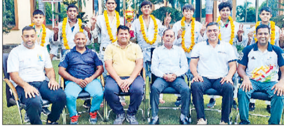
सोनीपत। विजेता खिलाड़ियों के साथ प्राचार्य एवं अन्य।