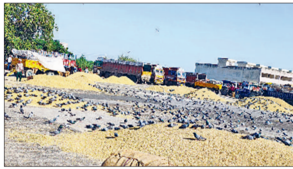
सोनीपत। धान की ढेरियां पर मंडरते कबूतर।