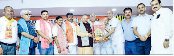
सोनीपत। कार्यक्रम में पहुंचे अतिथियों का स्वागत करते हुए।

अग्रवाल समाज ने सोमवार 22 सितंबर को महाराजा अग्रसेन की 5179वीं जयंती बड़े धूमधाम से मनाई। समारोह का आयोजन महाराजा अग्रसेन समाज कल्याण समिति के तत्वाधान में अग्रसेन भवन, सेक्टर-14 में किया गया। समारोह से पूर्व रविवार शाम को महाराजा अग्रसेन चौक और अग्रसेन परिसर में दीप प्रज्वलन किया गया। सोमवार को सुबह अग्रसेन परिसर में हवन का