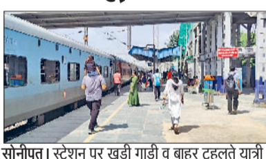
सोनीपत। स्टेशन पर खड़ी गाड़ी व बाहर टहलते यात्री