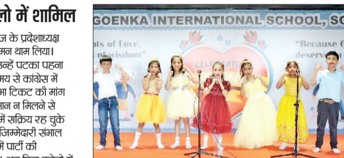
राई। सांस्कृतिक कार्यक्रम प्रस्तुत करते नहें- मुन्ने छात्र।

विपक्षी दल केवल भ्रम फैलाने का काम कर रहे हैं हरिभूमि न्यूज ►► गन्नौर