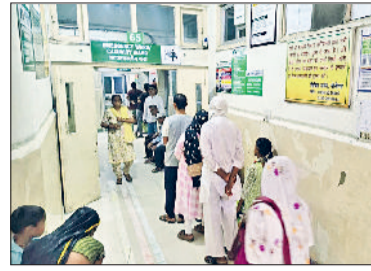
एमरजेंसी के बाहर लगी मरीजों की लाइन।

भीड़ के चलते मंगलवार को एमरजेंसी में कई बार बना तैनावपूर्ण माहौल