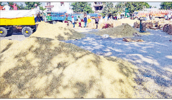
सोनीपत। अनाज मंडी में लगी धान की ढेरियां।